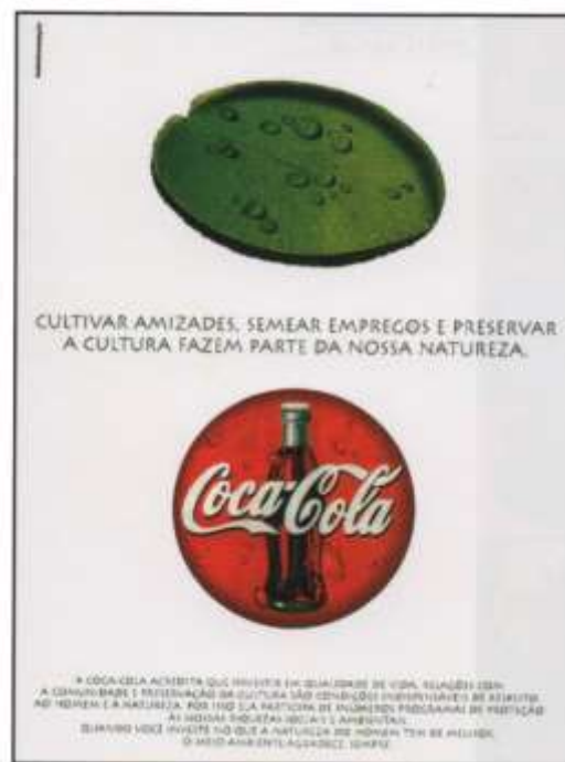
Figura 1: Anúncio Coca-Cola

Dentro desse contexto, faremos a análise de uma peça publicitária da Coca-Cola, publicado na revista Veja , especial sobre a Amazônia, em março de 1995, e criação da agência de publicidade CaliaAssumpção. O referido anúncio (Figura 1) é construído de modo a apresentar o produto e, ao mesmo tempo, tentar legitimá-lo como uma bebida agradável, e até mesmo “saudável”, na medida em que procura torná-lo familiar ao universo de experiências de seus interlocutores. E a força simbólica do produto é representada pela marca e reforçado pelo discurso ecológico da Coca-Cola, num autêntico apelo em defesa da natureza, “amazônica”, principalmente.